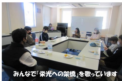
みんなで「栄光への架橋」を歌っています