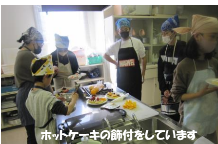
ホットケーキの飾付をしています

し、手際よく作りました。自分のホットケーキに生クリームとフルーツ（オレンジ・いちご）を飾り付けて完成です。そして、机を囲んでホットケーキを食べながらの茶話会です。簡単なゲームもしました。思い出話や励ましの言葉で良い雰囲気を送る会でした。最後に花束とみんなのメッセージを載せた色紙を贈りました。