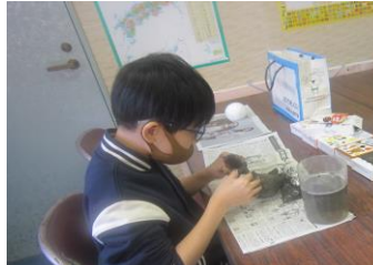
紙粘土で人形作り

今年度は中学生 2 名が卒業し、13 名でのスタートです（通室の継続希望の確認を学校よりしていただきます）。卒業生の 1 名は、あじさいルーム開設（令和 4 年 6 月）すぐに通室を申込み、学校との連携した支援で、完全不登校から別室登校、学校行事への参加を経て学校復帰に至り、希望を持って卒業しました。また、訪問支援を行っている中学生 2 名は、4 月になったら登校するために生活リズムを変えようとして取り組んでいます。新しい環境で新しいスタートを切るこの 4 月、子供たちの一歩前に進む姿を楽しみにしています。