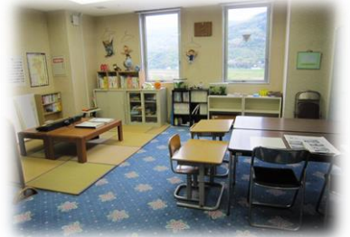
教育委員会が在るシビックセンターの4階に活動ルームがあります。

不安や悩みがあって、学校に行けない、または、その傾向にある子供(小・中学生)が学校に籍を置いたまま通う教室です。子供や保護者の意思を十分に尊重しつつ、社会的に自立することを目指せるよう、きめ細かな支援を行うところです。